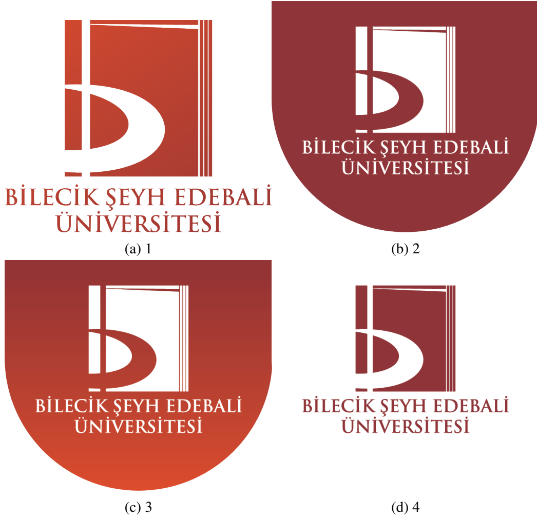
Şekil 1.3: BSEU Logo örnekleri