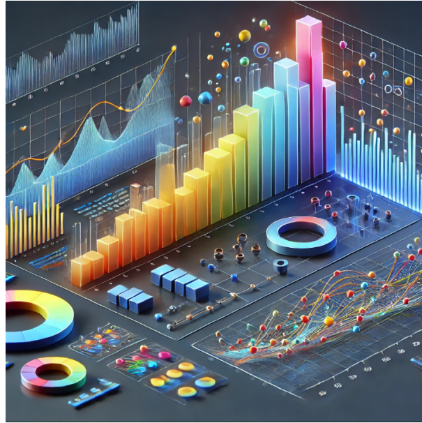
Şekil 2.2: Örnek bir veri görselleştirme grafiği (chatGPT ile üretilmiştir)

Verilerin işlenmesi ve görselleştirilmesi sürecinde Pandas ve Matplotlib gibi Python kütüphaneleri kullanılmıştır. Büyük ölçekli veri analizleri için Tableau ve Power BI gibi araçlar da yaygın olarak tercih edilmektedir. Şekil 2.2 bir örnek veri görselleştirmesi sunmaktadır.