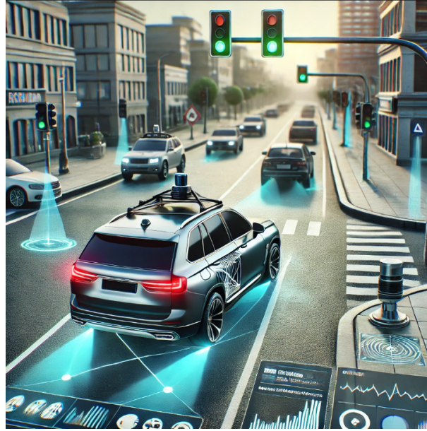
Şekil 3.1: Otonom araç simülatörüne ait bir görüntü (chatGPT ile üretilmiştir)

Simülasyonun geliştirilmesinde Python programlama dili, ROS (Robot Operating System) ve Gazebo simülatörü kullanılmıştır. Derin öğrenme tabanlı karar alma mekanizmaları için TensorFlow ve PyTorch gibi kütüphanelerden faydalanılmıştır. Ayrıca, OpenCV ile görüntü işleme teknikleri uygulanmıştır.